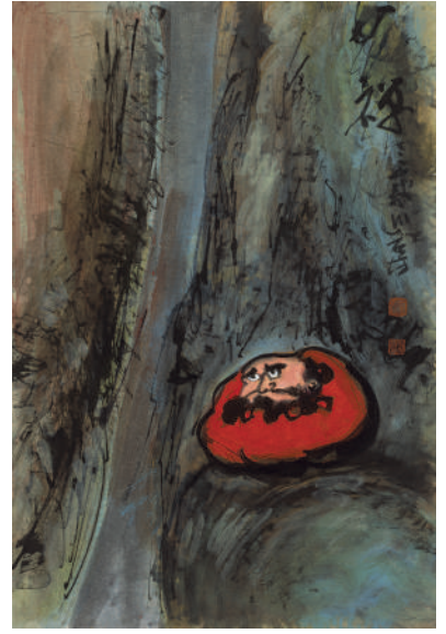
黃歌川 禪 1997 彩墨紙本 60×40cm