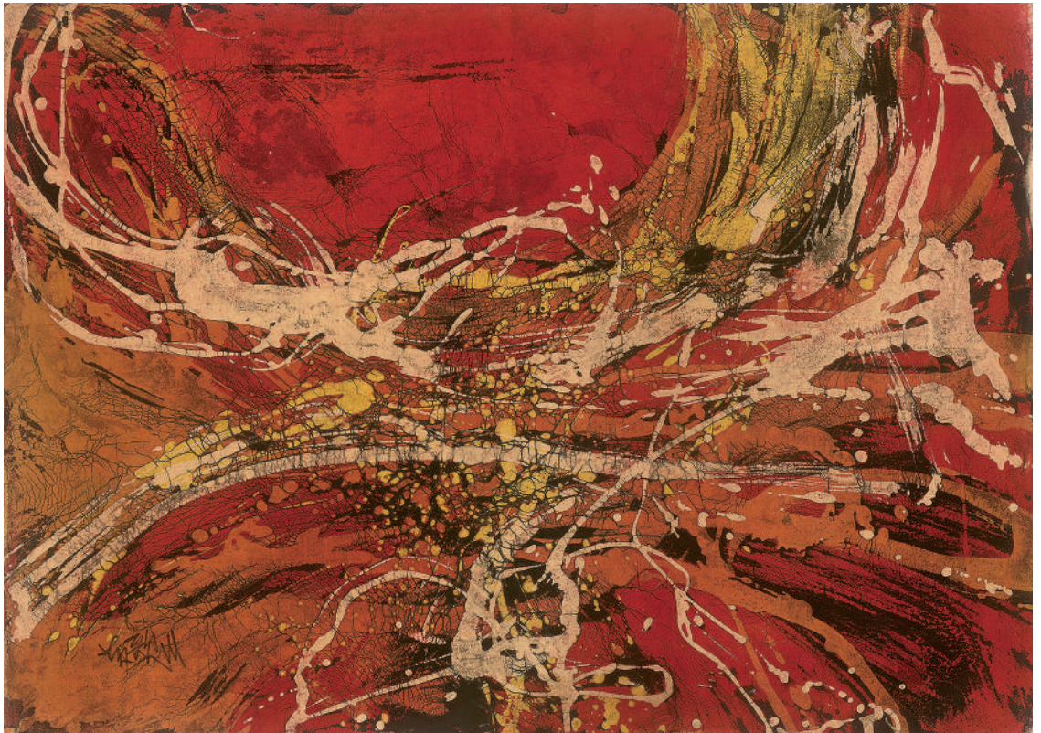
黃歌川 聚流 1975 蠟染畫布 60×83cm

代美術大系：寫景造境水墨（水墨類）》、《茶湯藝術論》等。他以豐富的歷史背景做為開頭，