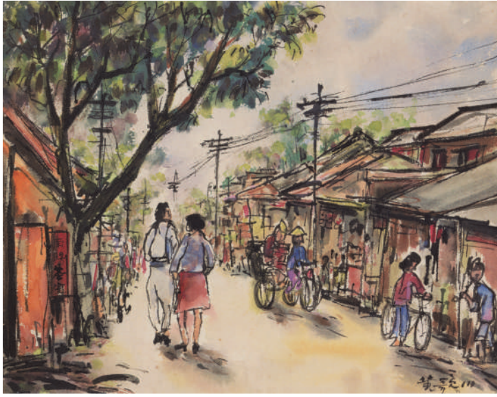
黃歌川 臺北街景 1955 水彩紙本 39×50cm 國立歷史博物館藏